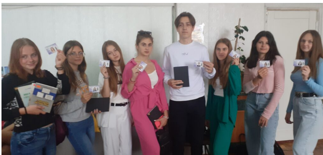
Наукова бібліотека Хмельницького національного університету